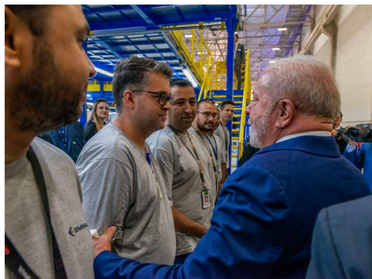
Presidente Lula saluda a empleados de Embraer en la línea de producción de Gripen